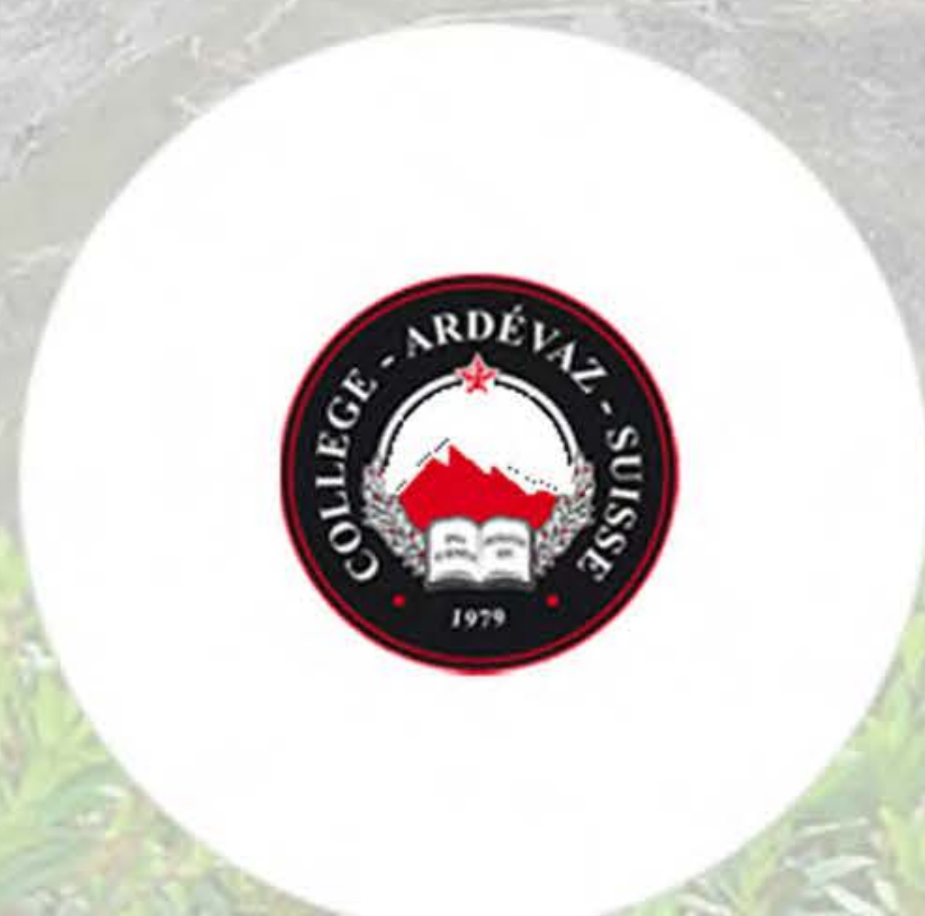
В сфере образования с 1979 года