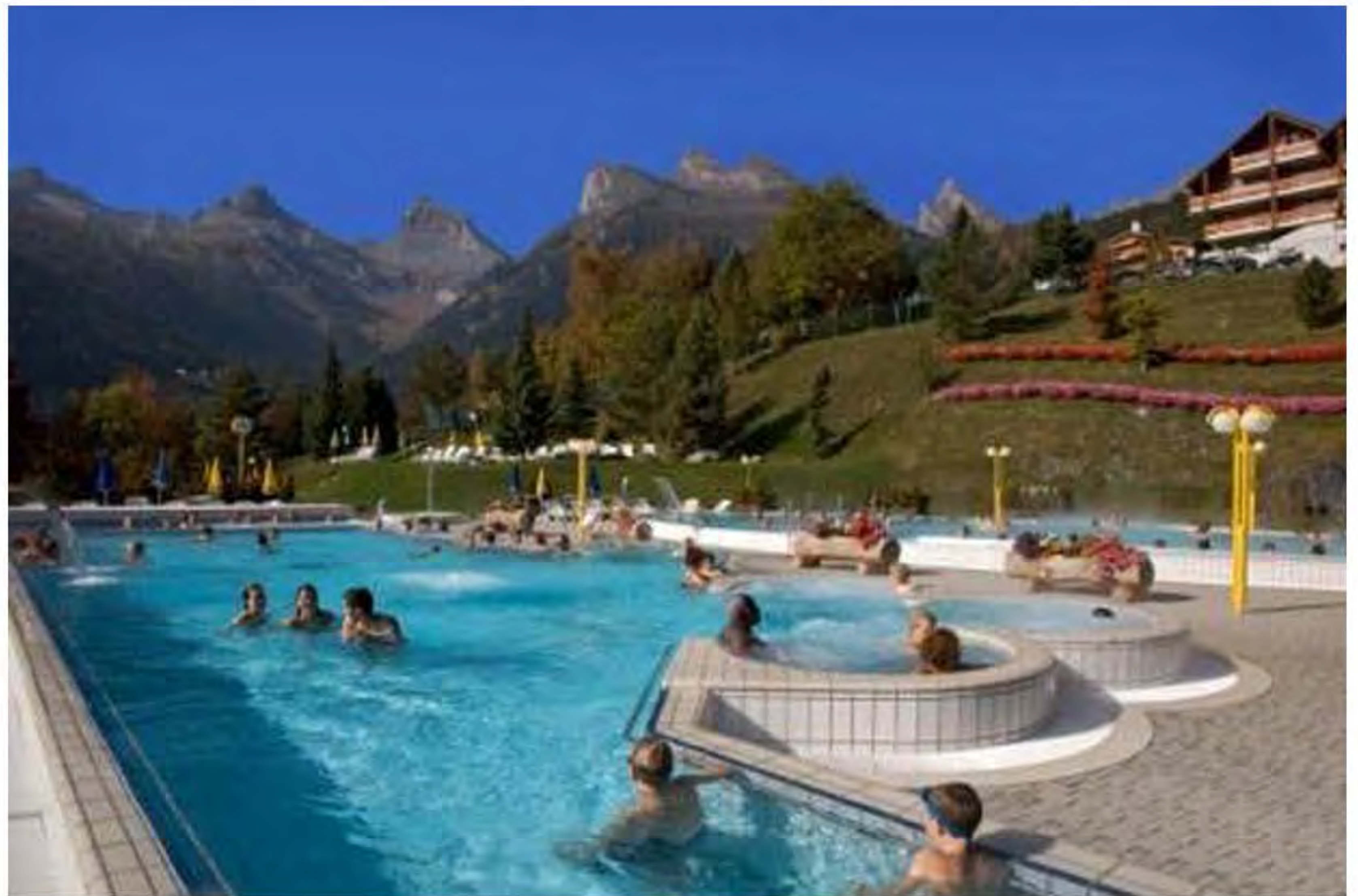
The resort's luxury pool and spa