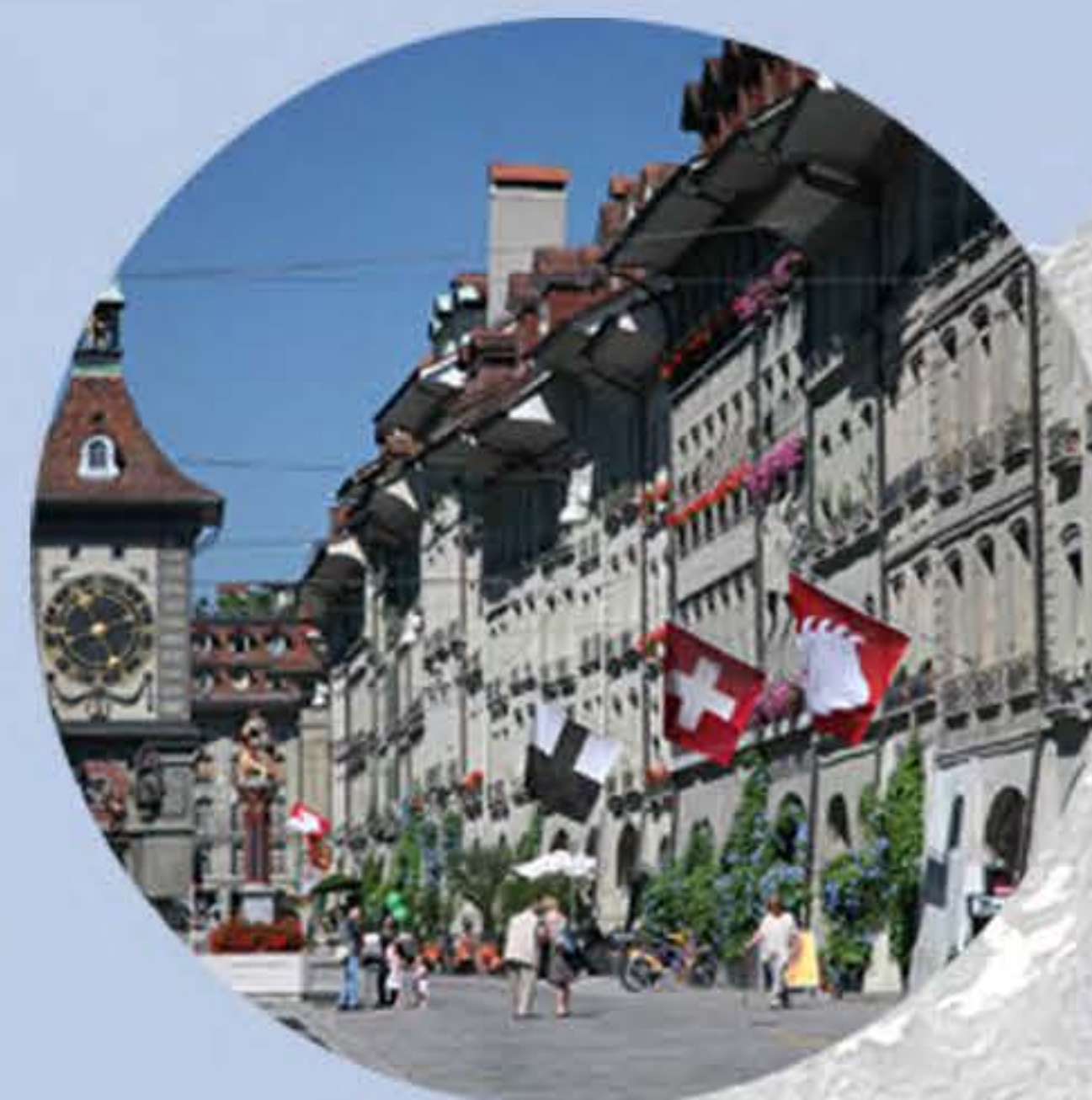
Познавательные поездки в города и деревни