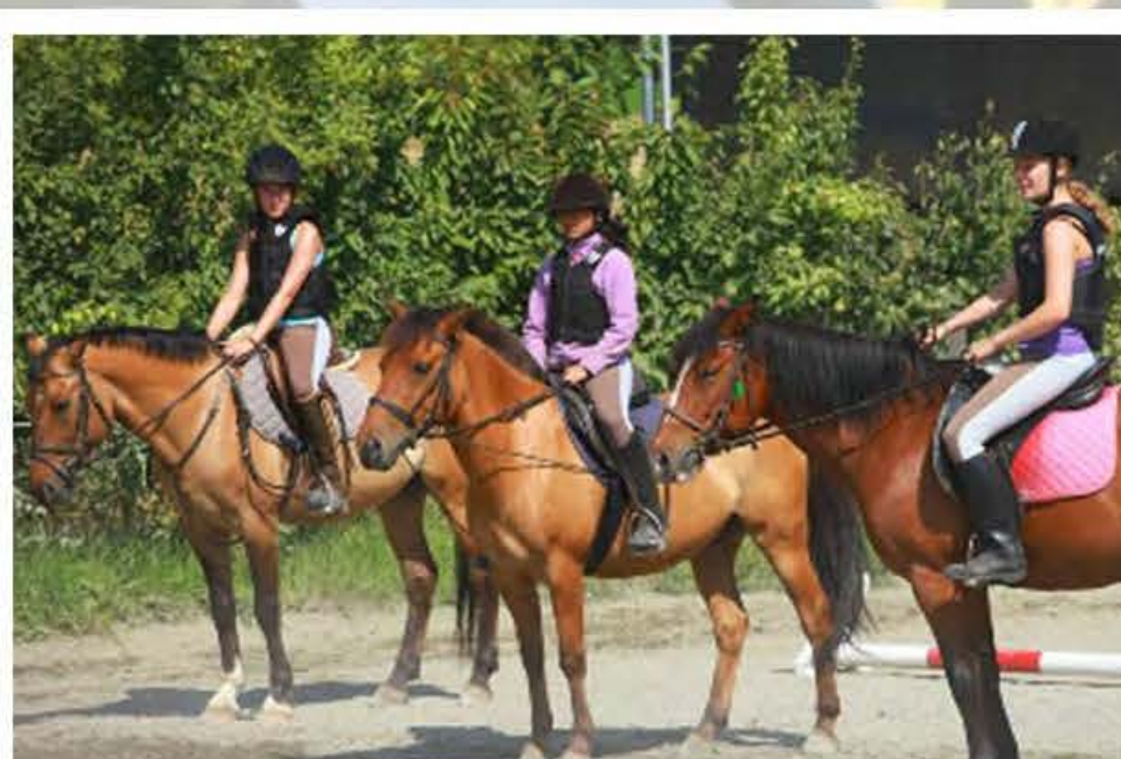
Верховая езда (дополнительная оплата)