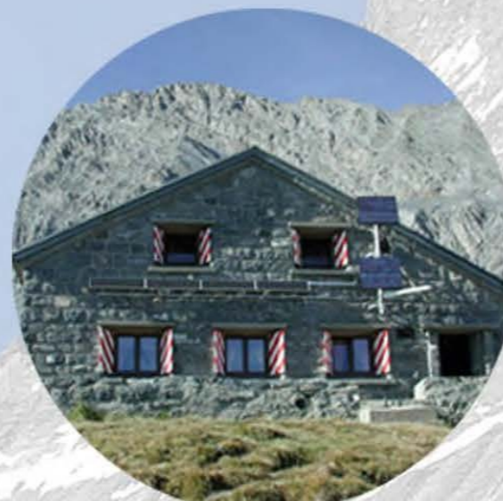
Ночевка в горной хижине