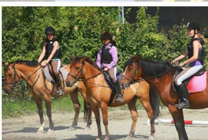
Верховая езда (дополнительная оплата)