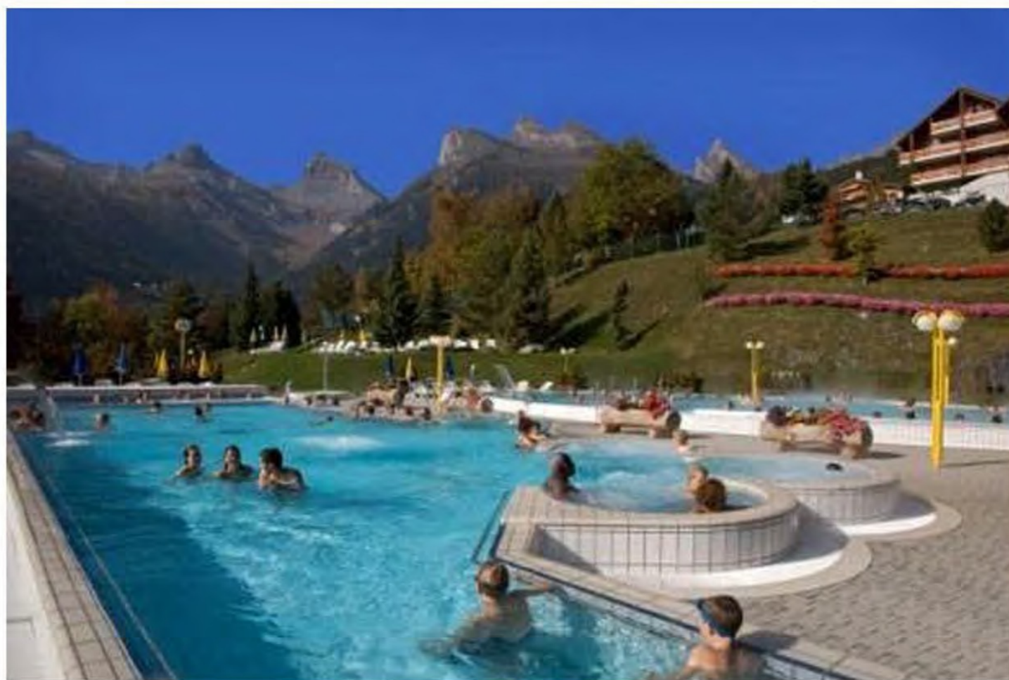
The resort's luxury pool and spa