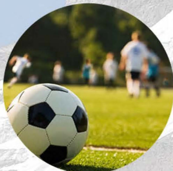
Веселые развлечения, спорт и искусство