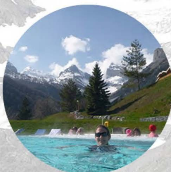
Горячие источники в окружении альпийских гор