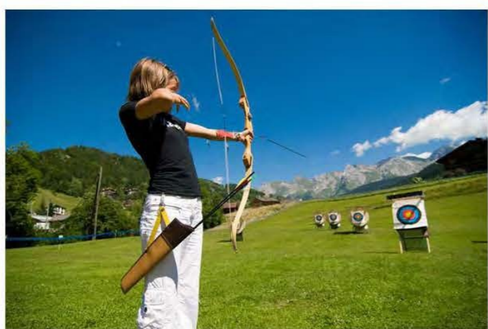
Стрельба из лука