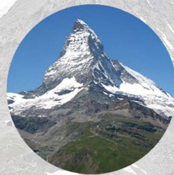
Парк развлечений или Церматт