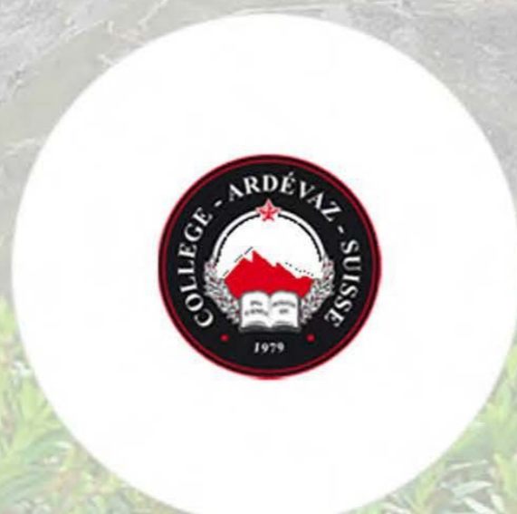
В сфере образования с 1979 года