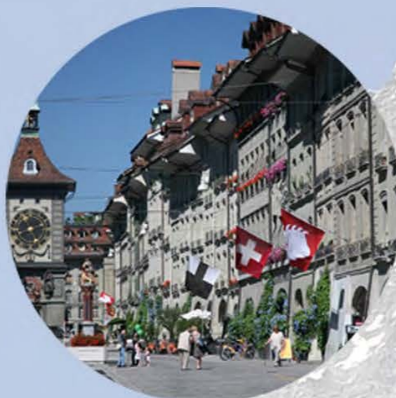
Познавательные поездки в города и деревни