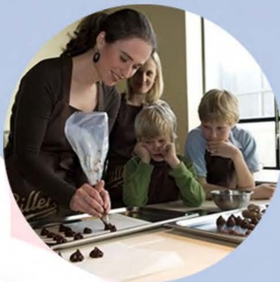
Культурные поездки – Швейцарское наследие